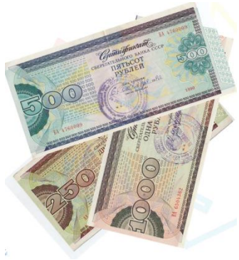
Схема учета сберегательных сертификатов